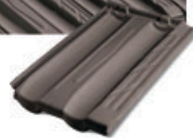
Falzziegel Ma.Xi.Ma. AM 01G Ardesia