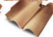
Unicoppo Extra EU 01G