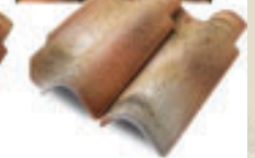
Unicoppo Extra SL 01G „a mano“