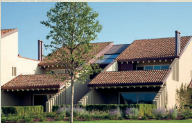
Mönch & Nonne