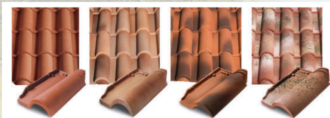
Romano Te.Si.12 RZ 01 Rosso