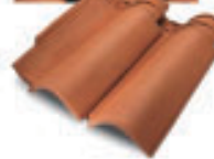
Unicoppo Extra RU 01G Rosso