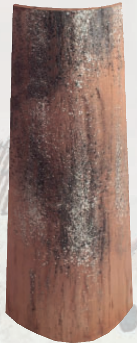
Mönch & Nonne „a

Planer und Bauherren nutzen gerne diese Ziegelform, um den Häusern einen mediterranen Stil zu verleihen. Besonders der