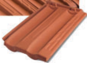
Falzziegel Ma.Xi.Ma. RM 01G Rosso Nuacè