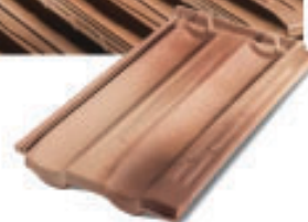
Falzziegel Ma.Xi.Ma. SM 01G Serenissima