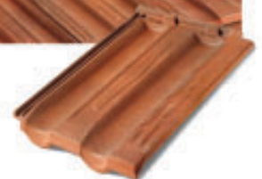
Falzziegel Ma.Xi.Ma. NM 01G Rouge